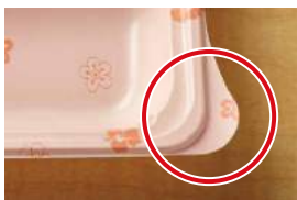
羽がついて開けやすい

おかずの容器には、容器本体と蓋にそれぞれ羽を付けています。この羽の部分をつまんで頂くと、簡単に開けることができます。少々手に力が入らない方も簡単に開けられます。