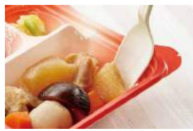
スプーンを使って最後の一口まですくいやすい形状