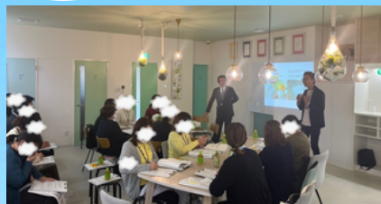
※豊橋店開催時の写真および参加者アンケート抜粋